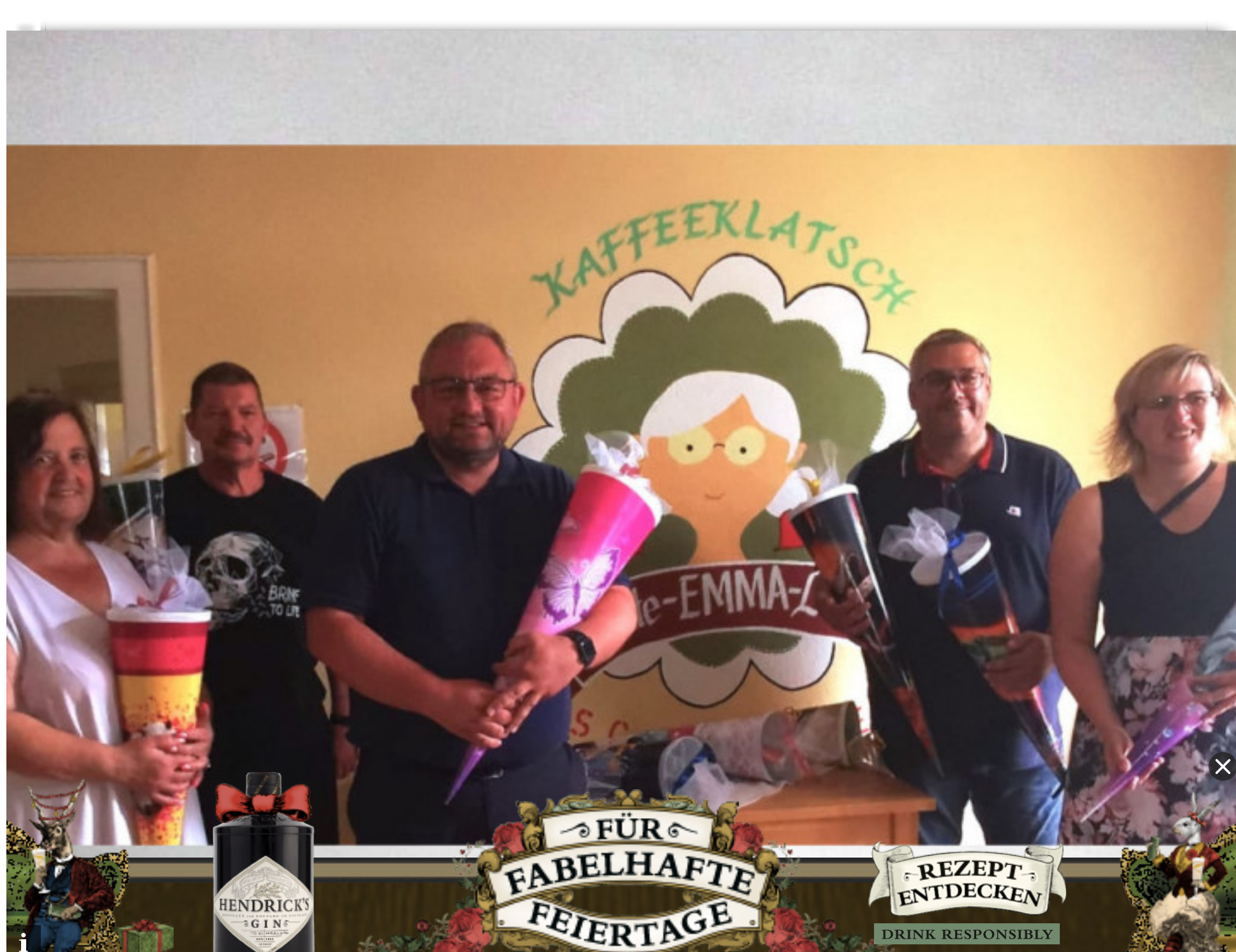
Die Schultüten wurden übergeben.

In den kommenden Tagen werden die zukünftigen Erstklässlerinnen und Erstklässler eine Erstausrüstung für die Schule und einige Süßigkeiten erhalten.